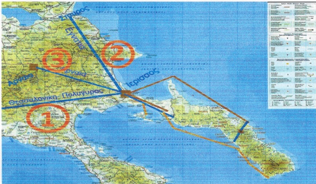
Οδικοί και θαλάσσιοι συγκοινωνιακοί άξονες στον δήμο Αριστοτέλη