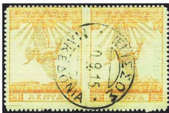
Γραμματόσημα της σειράς "Εκστρατείας" σφραγισμένα στο Ταχυδρομείο της Ιερισσού το 1913 και το 1915 αντίστοιχα.